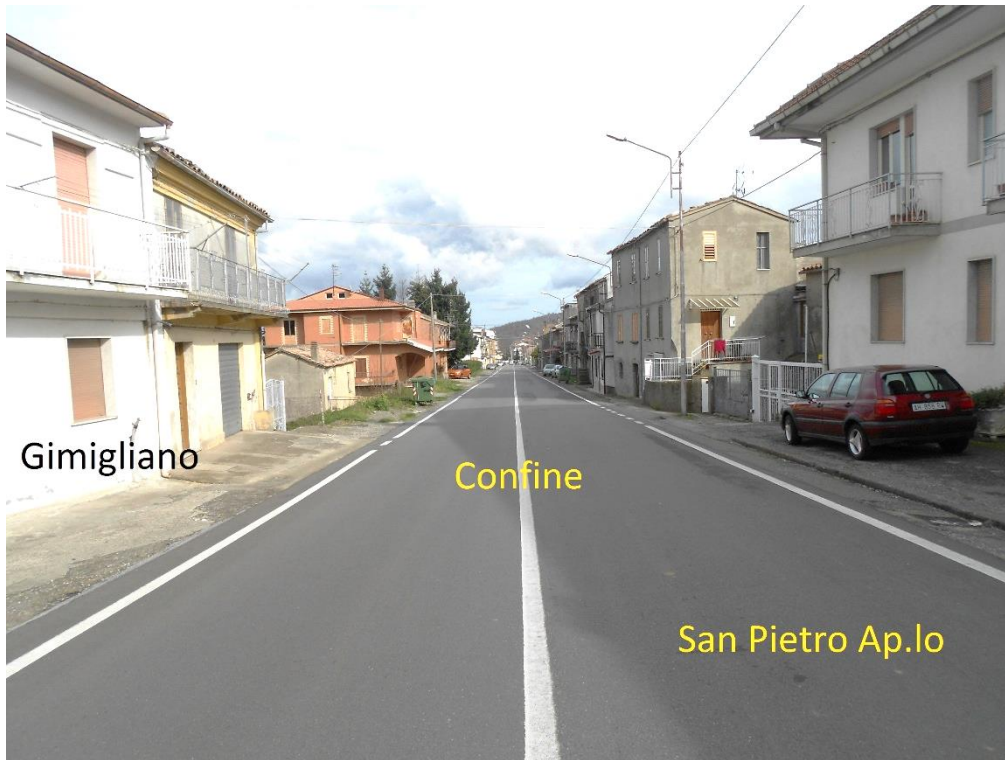
Figura 11 – Corso Vittorio Emanuele II, visto dalla Chesa