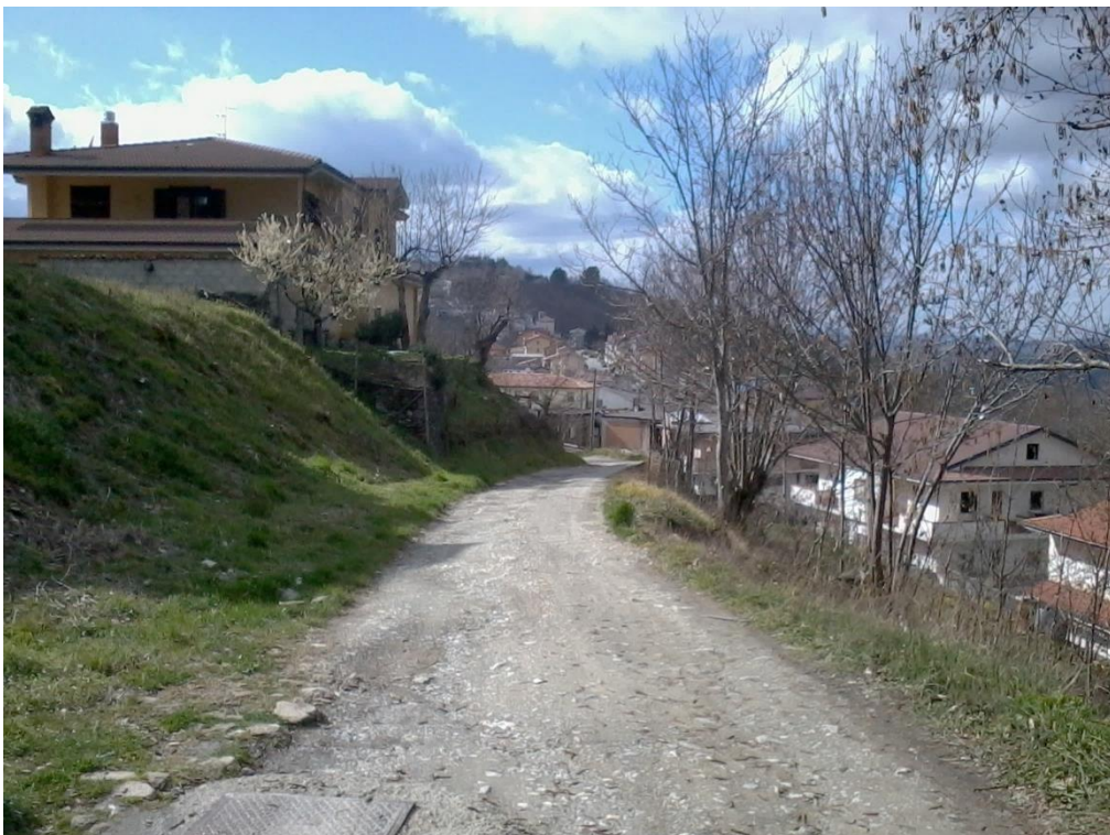
Figura 16 – Lottizzazione di contrada Colla, strada interna tra i lotti