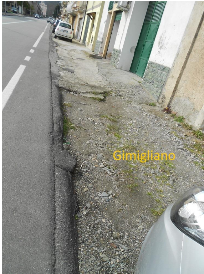
Figura 5 – Corso Vittorio Emanuele II, lato Gimigliano senza marciapiede