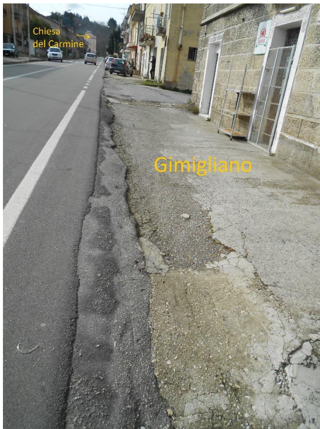
Figura 6 - Corso Vittorio Emanuele II, lato Gimigliano senza marciapiede