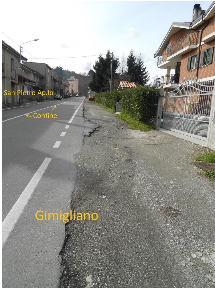
Figura 9 – Corso Vittorio Emanuele II, lato Gimigliano senza nessun marciapiede