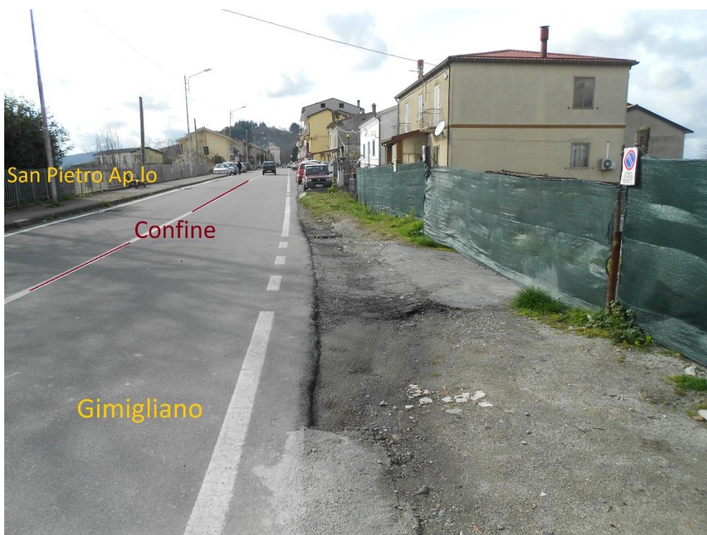
Figura 2 – Corso Vittorio Emanuele II, lato Gimigliano, senza alcun marciapiede