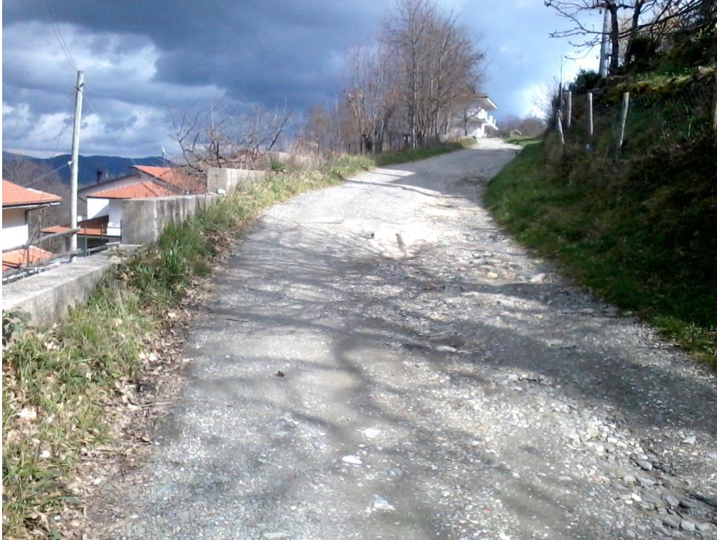
Figura 13 – Lottizzazione di contrada Colla, strada interna tra i lotti