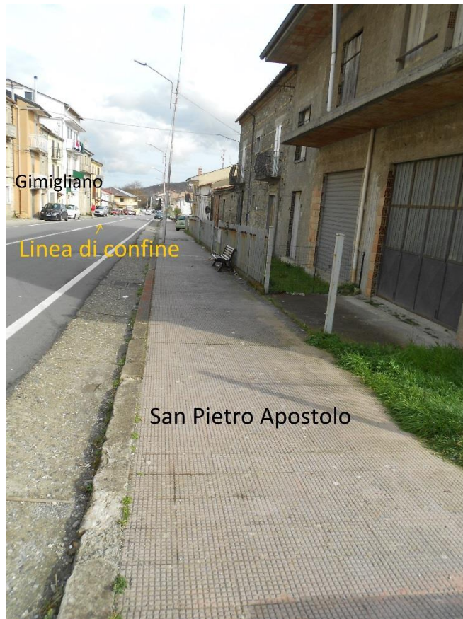
Figura 7 – Corso Vittorio Emanuele II, lato San Pietro Apostolo