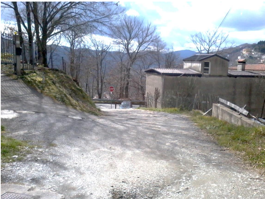
Figura 14 – Lottizzazione di contrada Colla, ingresso dalla SP 165/2