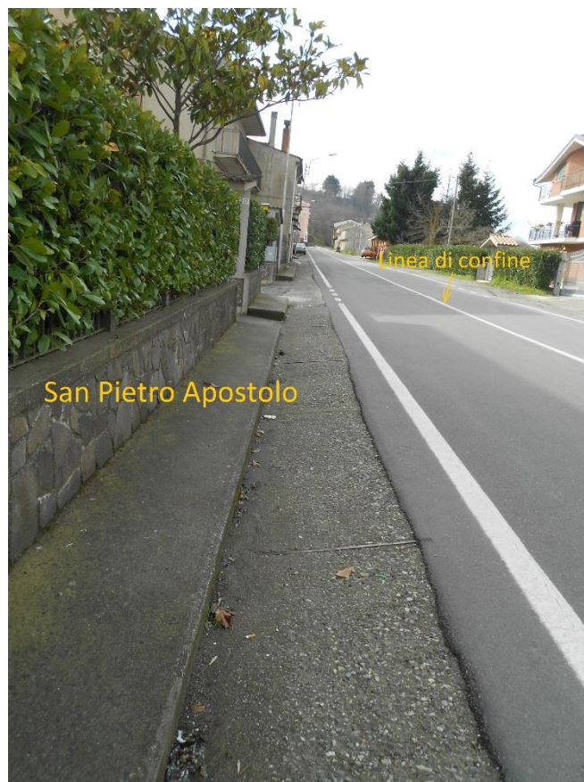
Figura 8 - Corso Vittorio Emanuele II, lato San Pietro Apostolo