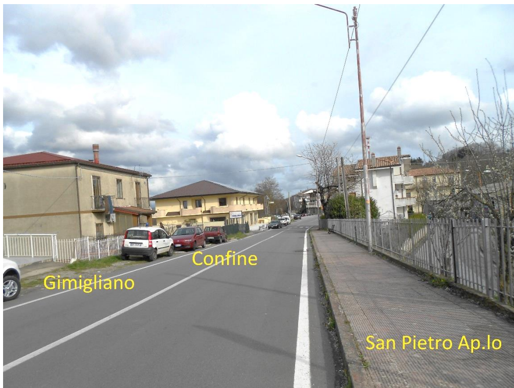
Figura 12 – Corso Vittorio Emanuele II, lato San Pietro Ap. Io, prima dell'ingresso al centro urbano