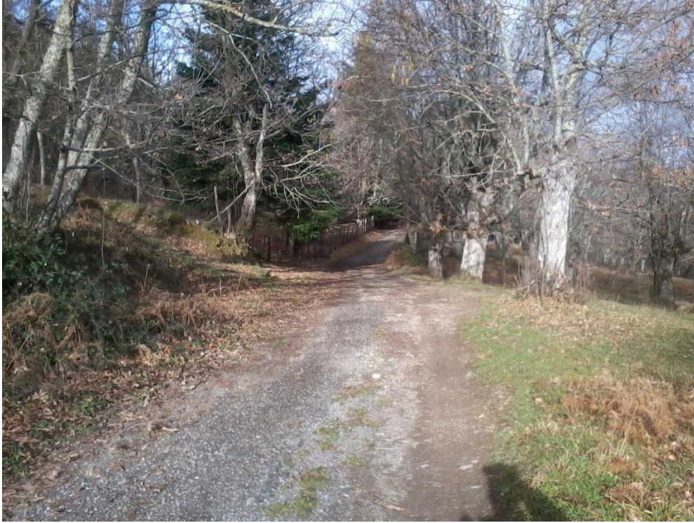
Figura 19 – Strada interpodereale delle Manche