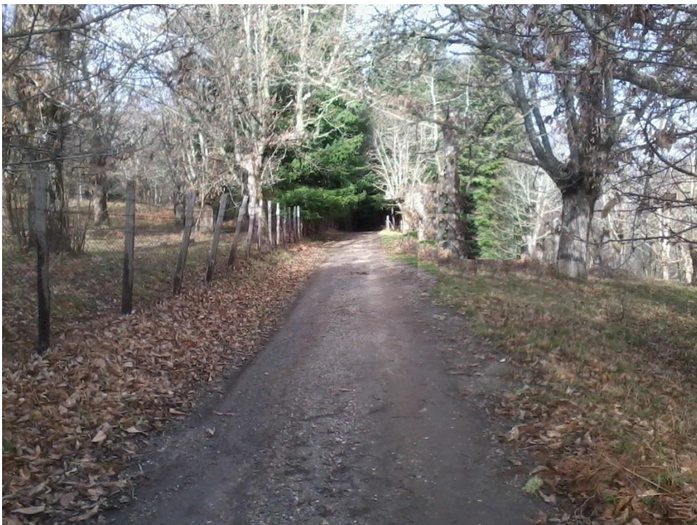
Figura 18 – Strada della Manche, individuata come possibile confine tra i due comuni