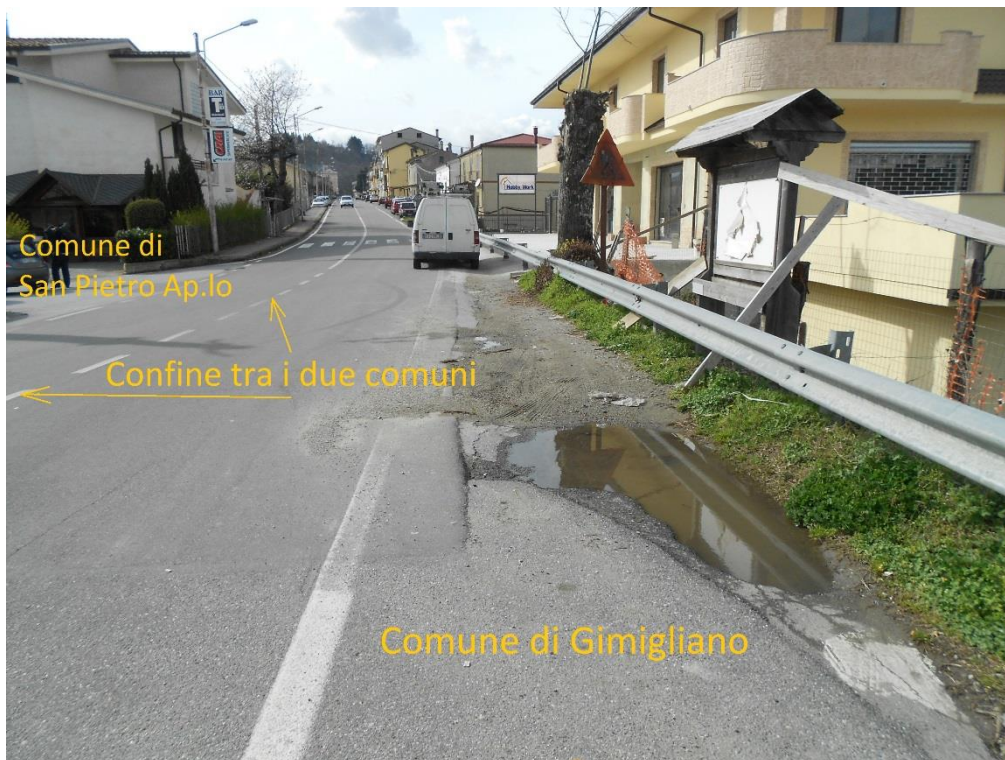
Figura 1 – Corso Vittorio Emanuele II all'ingresso del centro urbano di San Pietro Ap. lo