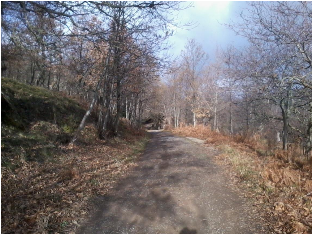
Figura 20 – Strada interpodereale delle Manche