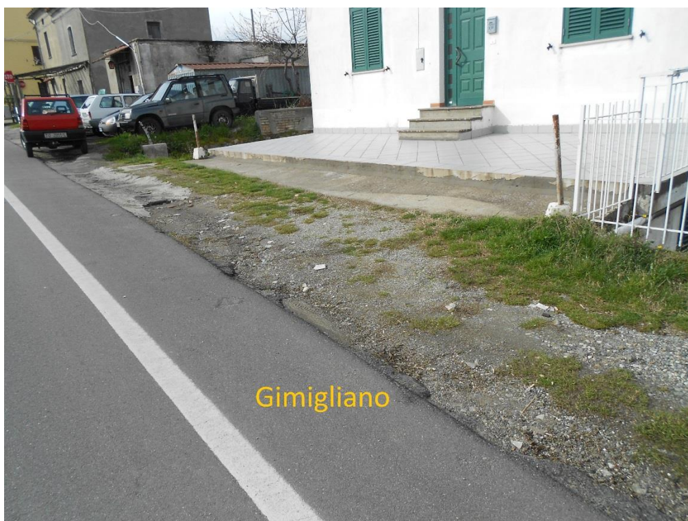
Figura 4 – Corso Vittorio Emanuele II, lato Gimigliano senza marciapiede