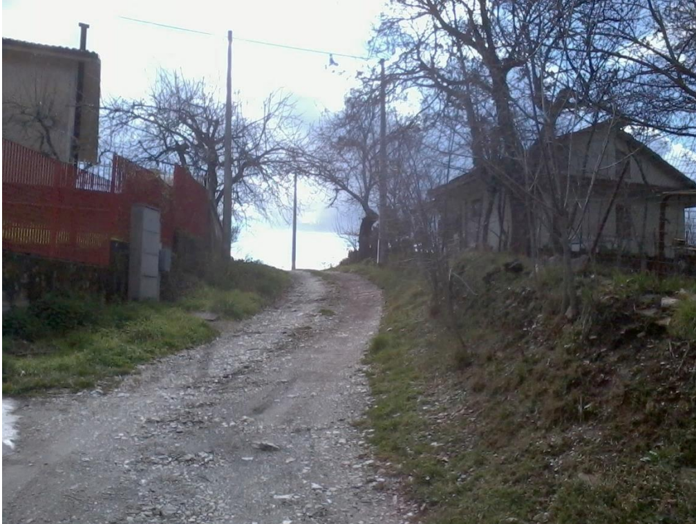
Figura 17 – Lottizzazione di contrada Colla, strada interna tra i lotti