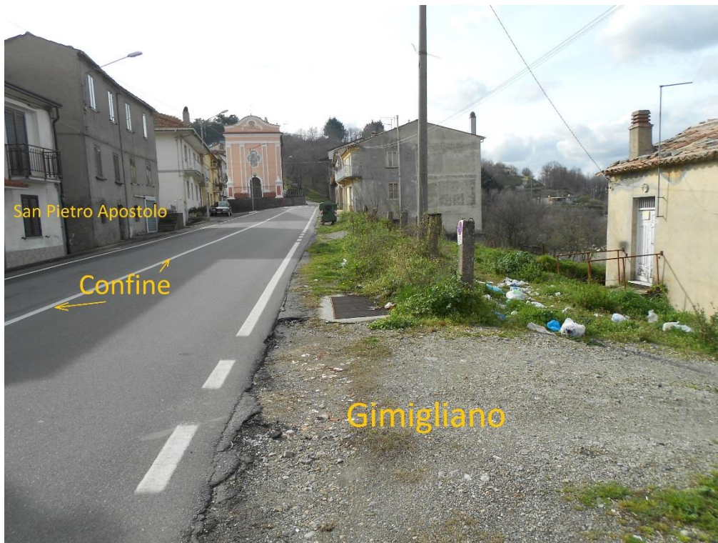
Figura 10 – Corso Vittorio Emanuele II, lato Gimigliano senza marciapiede