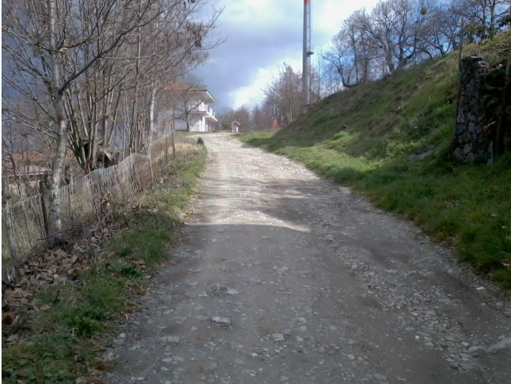
Figura 15 – Lottizzazione di contrada Colla, strada interna tra i lotti